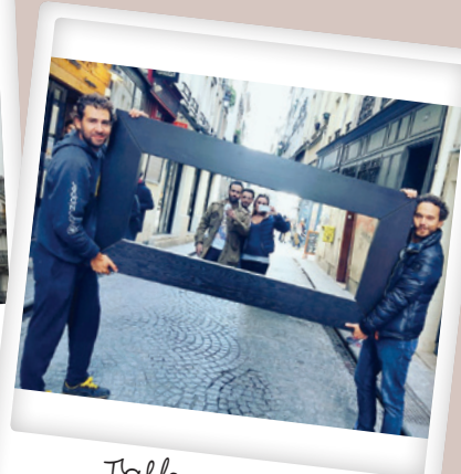
Tableau vivant par @juliezaze