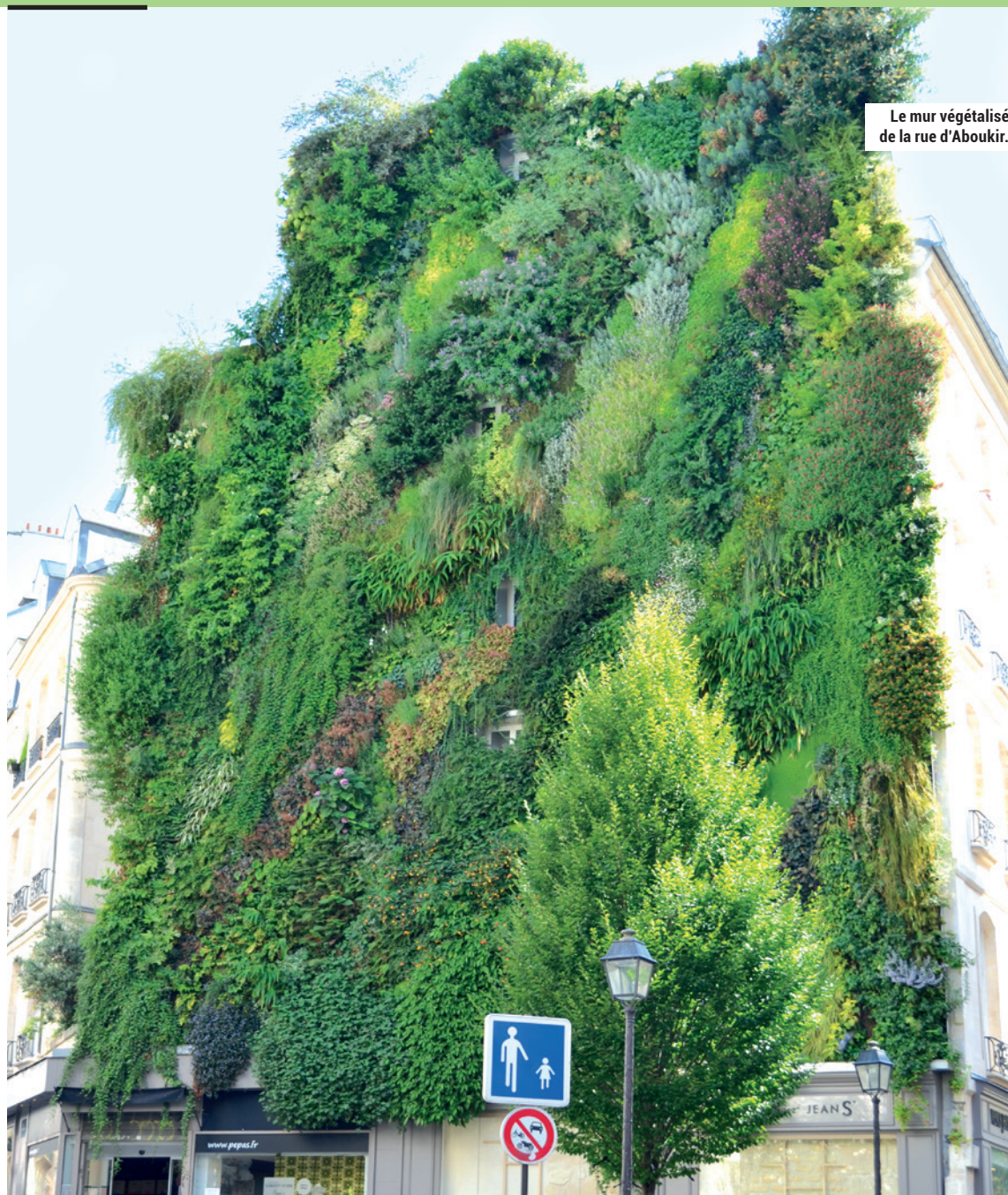
Le mur végétalisé de la rue d'Aboukir.