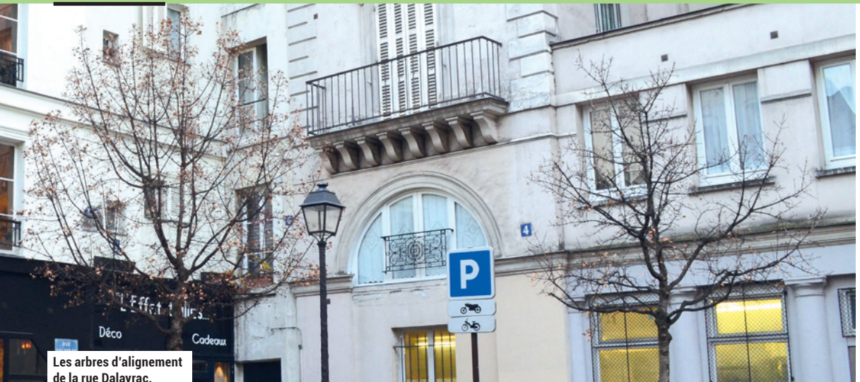
Les arbres d'alignement de la rue Dalayrac.

... dire ! D'ailleurs, les arbres ne se sont jamais vraiment développés. À nous d'inverser cette chaîne. »