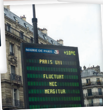
Paris uni