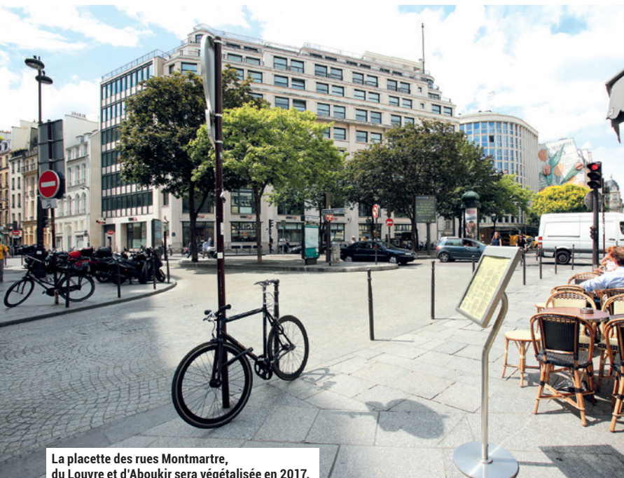
La placette des rues Montmartre, du Louvre et d'Aboukir sera végétalisée en 2017.