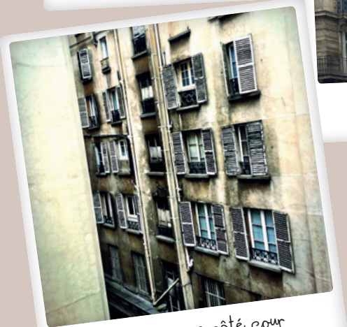
Rue Vivienne côté cour par @experimentalimageclub