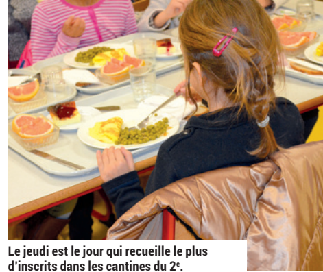
Le jeudi est le jour qui recueille le plus d'inscrits dans les cantines du 2 e .

dans les assiettes, tandis que le prestataire a su progressivement concocter des plats végétariens satisfaisants et savoureux. C'est ainsi qu'au fil du temps, ce repas hebdomadaire est devenu une habitude pour tous les convives. Certains parents le réclament désormais quotidiennement. Ainsi, dès le 1 er janvier, les cantines scolaires du 2 e arrondissement proposeront une alternative végétarienne tous les jours. Cette mesure est rendue possible du point de vue réglementaire par l'existence d'un choix carné quatre jours par semaine. Le cinquième