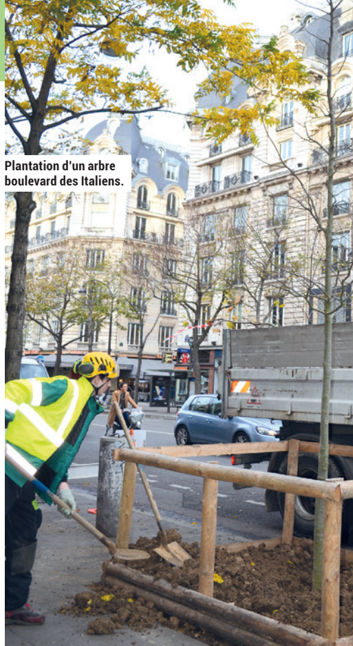
Plantation d'un arbre boulevard des Italiens.