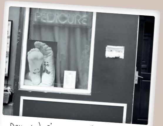
Deux pieds s'aimaient d'amour tendre par @cstefone

Vous avez saisi un événement de notre arrondissement ? N'hésitez pas à nous adresser vos clichés par courriel à mairie02@paris.fr ou sur Instagram avec #Paris02. Et n'oubliez pas de suivre @Mairiedu2 !